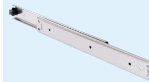
Stainless steel Acier inoxydable Edelstahl