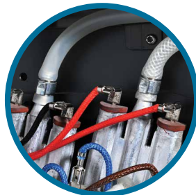
Dağıtıcı ve Isıtıcı Arası