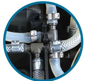
Isıtıcı ve Demleyici Arası