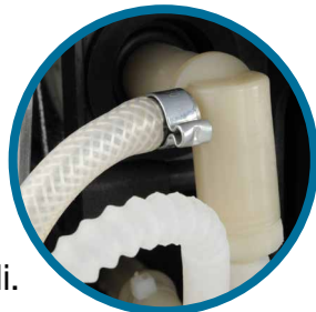
Pompa ve Dağıtıcı Arası